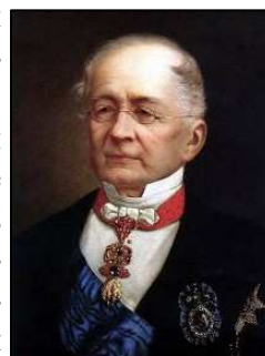
Светлейший князь А. М. Горчаков (1798-1883)

Князь Александр Михайлович Горчаков для российской дипломатии сделал очень многое. При этом он порой принимал решения, которые Европу не просто удивляли, а приводили в ужас. В соответствии с Парижским договором Россия не могла размещать свой военный флот на Чёрном море. Какое-то время этот договор соблюдался, но долго такое положение вещей продолжаться не могло. Решилась ситуация после того, как канцлер Горчаков, в ту пору министр иностранных дел Российской империи, издал циркуляр, в котором говорилось, что Россия выходит из Парижского договора и статьи его соблюдать отказывается.