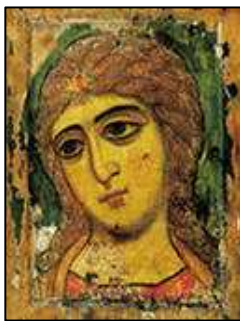
Архангел Гавриил, Россия, XVII век. Икона.

Многие считают дипломатов героями, которые предотвращают совсем не малое количество войн и связанных с ними жертв. Священное же Писание в отношении «рыцарей переговоров» недвусмысленно и категорично: «Блаженны миротворцы — ибо они сынами Божиими нарекутся». А есть ли у этой сферы деятельности святые покровители?