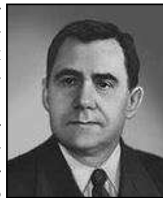
А. А. Громыко

Народный Комиссариат иностранных дел (НКВД) проделал в годы войны в высшей степени важную работу по созданию и укреплению антигитлеровской коалиции, быстрейшему открытию нашими западными союзниками второго фронта в Европе. Эта работа выполнялась как первыми лицами государства, так и выдающимися советскими дипломатами А. Я. Вышинским, М. М. Литвиновым, Н. М. Майским, А. Е. Богомоловым, А. А. Громыко, Ф. Т. Гусевым и многими другими.